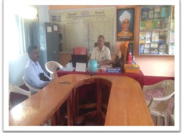
ಹೊಳಲ್ಕೆರೆ ವಿಭಾಗ - ಪ್ರಭು ಆರ್